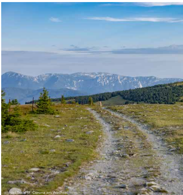
@Wexl Trails St. Corona am Wechsel