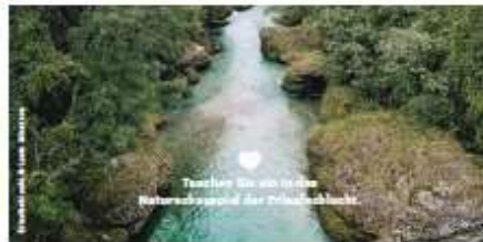
Tauschen Sie ein in die Naturerfahrung der Pöchlacher.