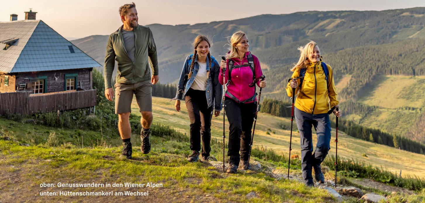
oben: Genusswandern in den Wiener Alpen unten: Hüttenschmankerl am Wechsel